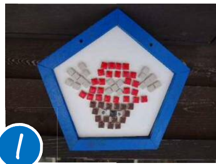
1 壁掛けモザイクタイル

カラフルなタイルで絵を描こう! 釘を使わないから小さなお子様におすすめの工作です♪