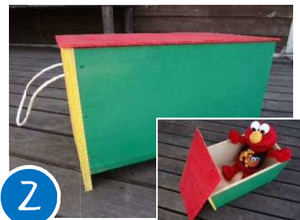
2 すいすい動く! おもちゃ箱

いろいろなおもちゃをそのまま入れるから片付け上手! 車がついているから移動もらくらく!