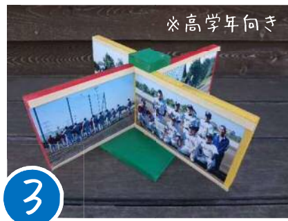
3 ※高学年向き くるくる写真立て