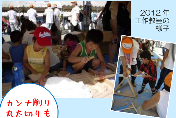
2012年 工作教室の 様子